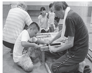
竹で水鉄砲をつくりました!

佐賀関地域を3地域(佐賀関、大志生木、木佐上)に分けて、地域に住む小学生や保護者を対象とした児童夏休み工作教室を開催しています。多くのボランティアさんや育成クラブなどの協力により、今年度は小学生が3地域合計で約70名が参加しました。