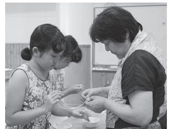
ビーズのストラップをつくりました!