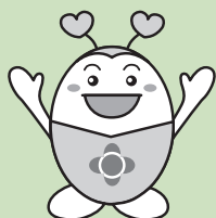
ふくしのピロロちゃん

災害発生時のボランティア活動を円滑に進めるための組織で、被災者支援の拠点となります。災害時の支援活動では、地域住民や様々な関係機関と協力することが重要になるため、平時よりボランティアや地域の方々とのつながりがある地元社協が設置・運営することが多くなっています。