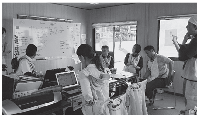
▲災害ボランティアセンターに集まる被災者のニーズを把握し、迅速なボランティア活動に繋がります

被災者が避難所から応急仮設住宅へ移り始める生活支援期に移行する段階では、支援のニーズも徐々に変化し、孤立防止や日常における関係づくりなど、被災者一人ひとりに寄り添った個別支援が求められるようになります。