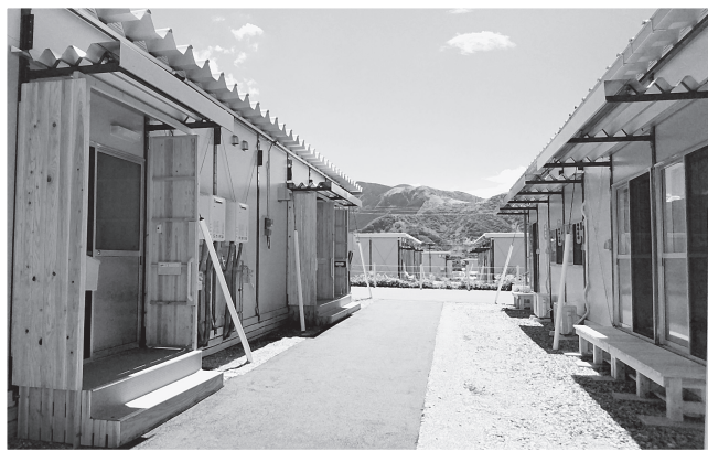
▲仮設住宅での生活が進む中で、求められる支援は徐々に変化しています

被災状況は地域によって様々ですが、震災直後の被災した家屋内外の後片付けや避難所での生活支援など、多くのボランティアの方々の力によって被災地の復旧支援が支えられました。